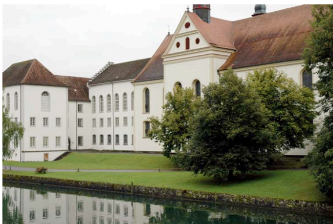
Klosterinsel Rheinau